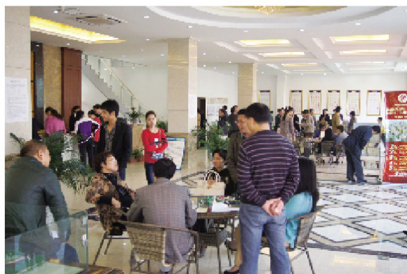
图为10月27日加推当天售楼部现场